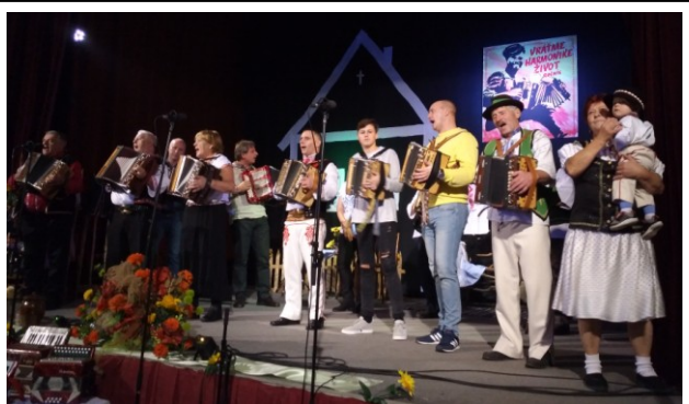
Plesne v ich podaní veselé, žartovné, rezké či ťahavé chytili za srdce divákov.