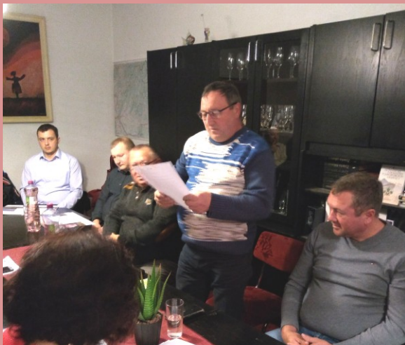
Novozvolení poslanci skladajú sľub